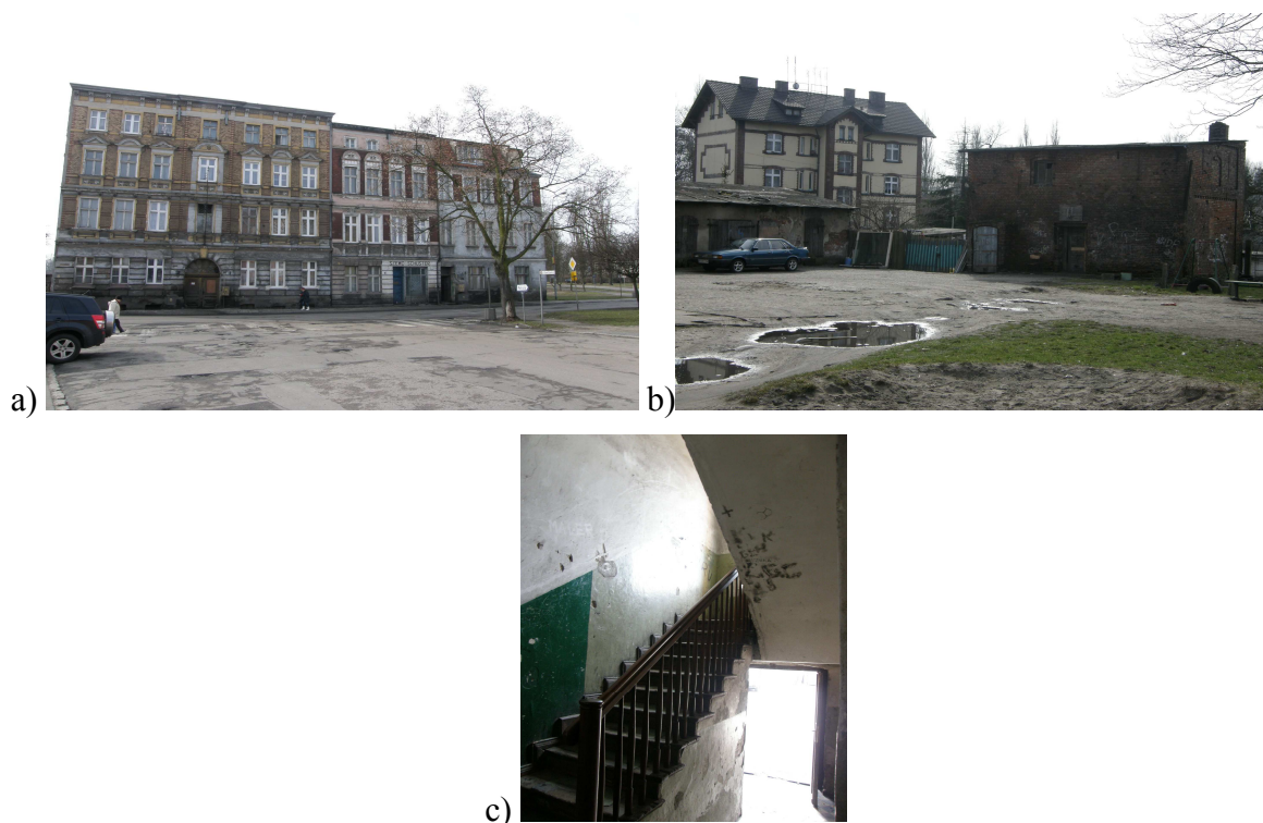
Ryc.6. Budynek przy ulicy Niepodległości 13-15: a) widok od frontu, b) niszczące budynki gospodarcze, c) zdewastowana klatka schodowa budynku przy ulicy Niepodległości 13