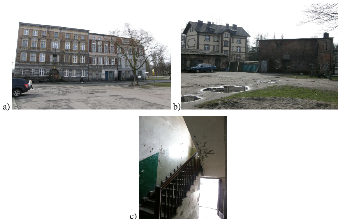
Ryc.6. Budynek przy ulicy Niepodległości 13-15: a) widok od frontu, b) niszczące budynki gospodarcze, c) zdewastowana klatka schodowa budynku przy ulicy Niepodległości 13