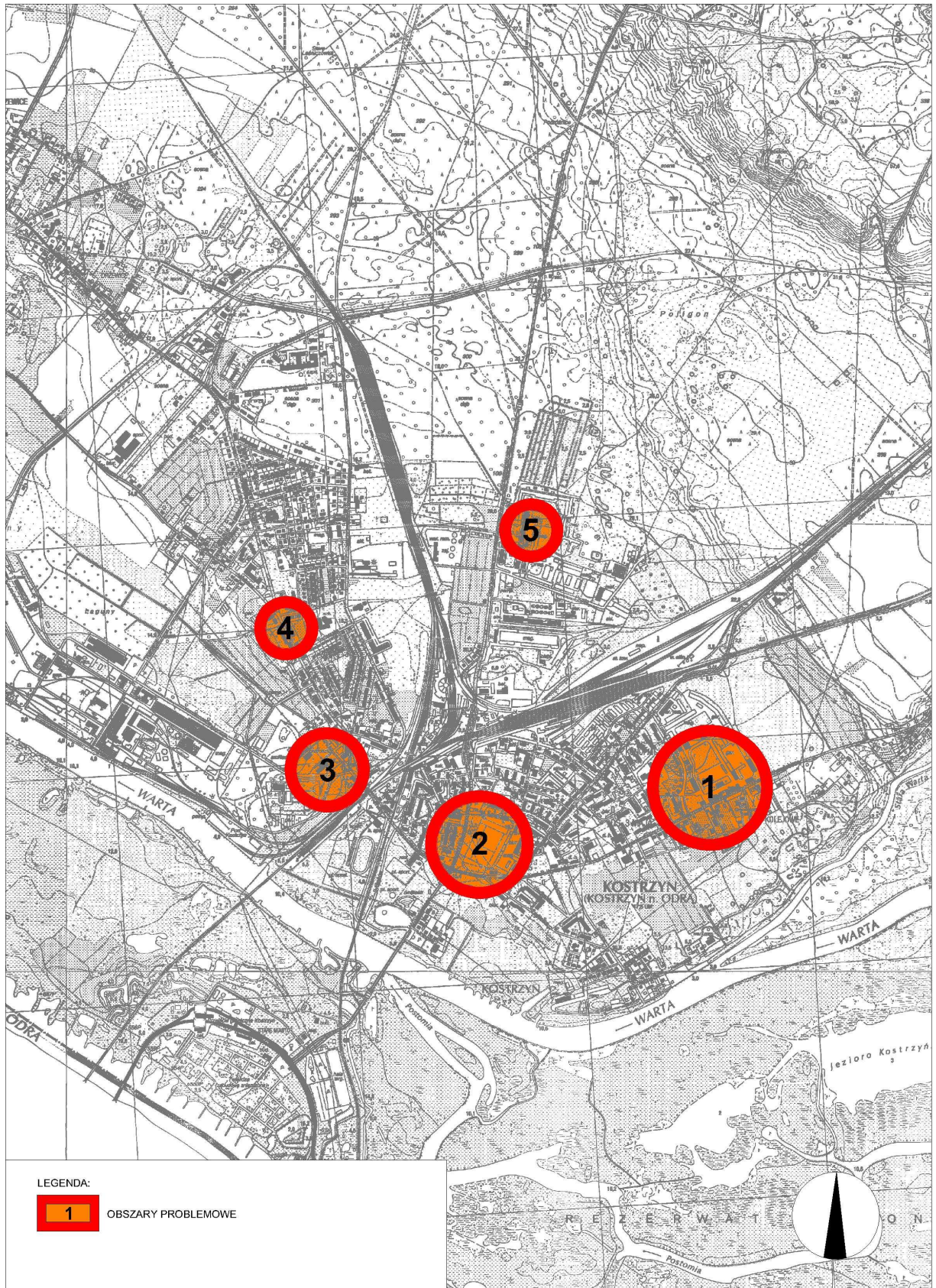
Ryc.8. Obszary problemowe w Kostrzynie nad Odrą – mapa syntetyczna