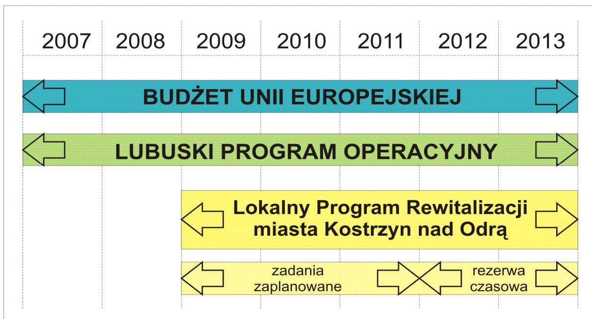
Ryc.1. Ramy czasowe realizacji Lokalnego Programu Rewitalizacji miasta Kostrzyn nad Odrą na lata 2009 – 2013

Zadania inwestycyjne zapisane w Lokalnym Programie Rewitalizacji miasta Kostrzyn nad Odrą, przewiduje się zrealizować w latach 2009 – 2011. Wybór takiego horyzontu czasowego podyktowany był koniecznością wskazania zadań priorytetowych oraz oceną możliwości współfinansowania poszczególnych zadań inwestycyjnych z funduszy europejskich. Natomiast lata 2012 – 2013 stanowią rezerwę czasową, przeznaczoną na umieszczenie w programie ewentualnych nowych zadań zgodnie z zasadą otwartości dokumentu, a także koniecznością jego aktualizacji.