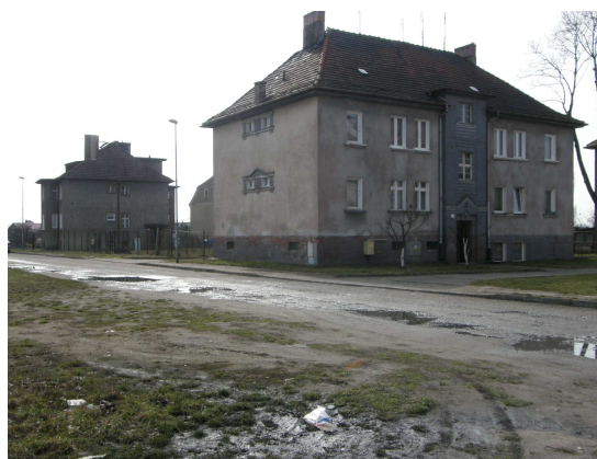
Ryc.5. Przedwojenna zabudowa Placu Grunwaldzkiego