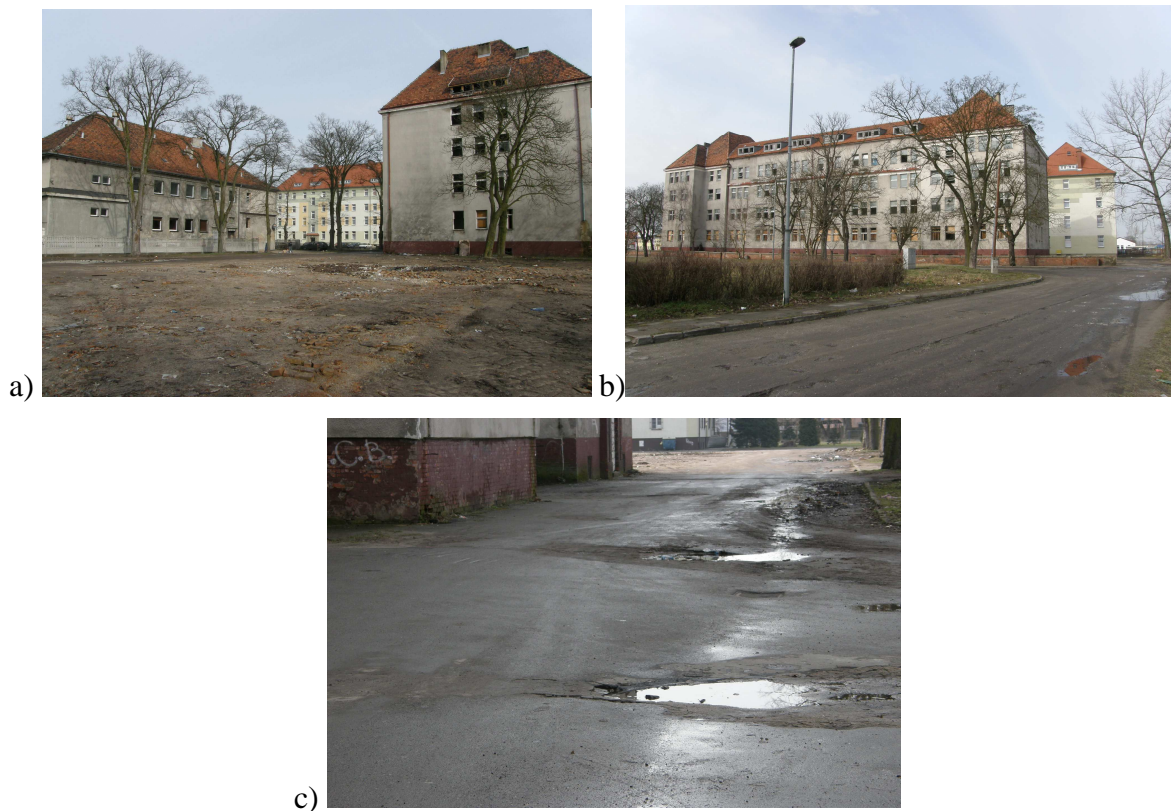
Ryc.4. Teren byłych koszar wojskowych: a) stan budynków, b) widok od strony ul. Jaworowej, c) stan dróg

przede wszystkim istniejąca zabudowa, która obecnie ulega dewastacji. Konieczne są również inwestycje w infrastrukturę techniczną, głównie kanalizację, gazociągi oraz oświetlenie. Brak oświetlenia, sprawia iż obszar ten uważany jest za niebezpieczny. Niezbędna jest poprawa stanu dróg wewnętrznych, które obecnie są w bardzo złym stanie technicznym uniemożliwiającym normalne poruszanie się pojazdów. Ponadto na terenie tym brakuje placów zabaw dla dzieci, urządzeń sportowych dla młodzieży, brak jest zieleni publicznej, miejsc rozrywek, a także zaplecza handlowo-usługowego.