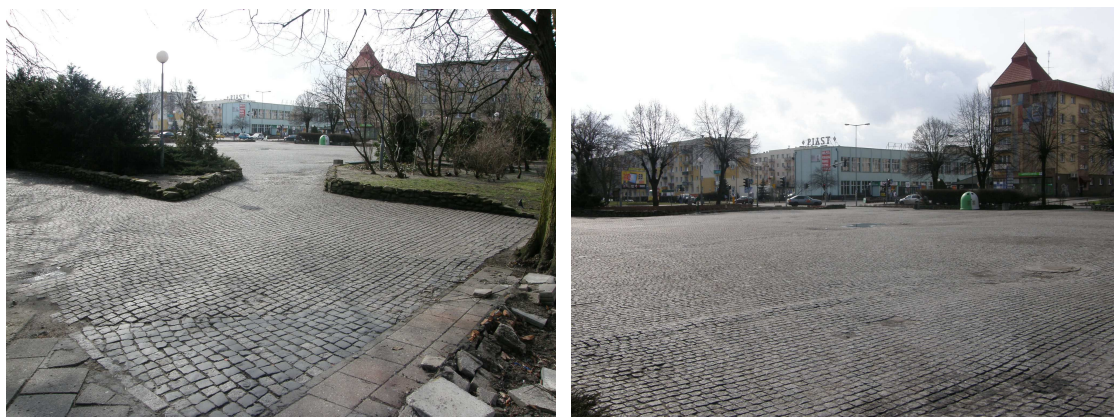
Ryc.3. Plac Wojska Polskiego – widok ogólny oraz stan nawierzchni

punkty handlowe, punkt gastronomiczny oraz ogólnodostępny parking. Plac Wojska Polskiego powinien stać się miejscem rozwoju kontaktów społecznych, miejscem odpoczynku oraz miejscem chętnie odwiedzanym przez turystów.