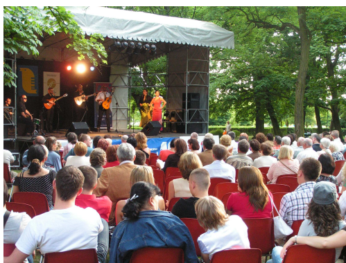
Ryc.2. Teren Parku Miejskiego – koncert dla mieszkańców miasta

Rewitalizacja Parku Miejskiego obejmować powinna zmianę jego zagospodarowania w zakresie: placów zabaw, urządzeń sportowych dla młodzieży, elementów małej architektury (ławki, kosze na śmieci), zwiększenia oświetlenia i zmiany nawierzchni alejek, uporządkowania szaty roślinnej, zagospodarowania górkę (np. ławki, zadaszenie). Park Miejski powinien być wizytówką centrum miasta i sprzyjać rozwojowi kontaktów społecznych, stać się miejscem, do którego chętnie uczęszczają mieszkańcy i gdzie każdy znajdzie coś dla siebie. Rewitalizacja funkcji użyteczności publicznej Parku Miejskiego jest niezwykle ważna dla ożywienia społeczno-gospodarczego i uzyskania ładu przestrzennego.